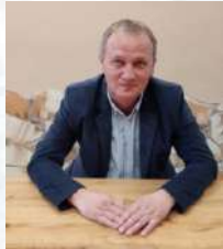
Zalavölgyi László polgármester