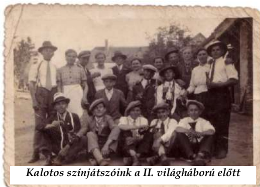
Kalotos színjátszóink a II. világháború előtt