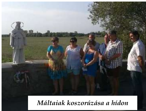
Máltaiak koszorúzása a hídon