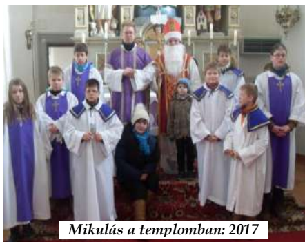
Mikulás a templomban: 2017

három harang lakozik. A nagyharangot 1865-ben Haller József öntötte Szombathelyen. A kisharangot „Isten dicsőségére, Magyarország Nagyszonya tiszteletére a káptalanfai hívek közadakozásából” 1925-ben öntötték Seitenhofer Frigyes fiai Sopronban.