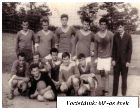
Focistáink: 60'-as évek

A vasanyagot pl. a Széles csapáson levő nagyméretű kukoricagóré elbontásával biztosították a kapukhoz és kerítéshez. A földmunkáknál a tsz segített gépekkel és buszt is biztosított a csapat utaztatásához.