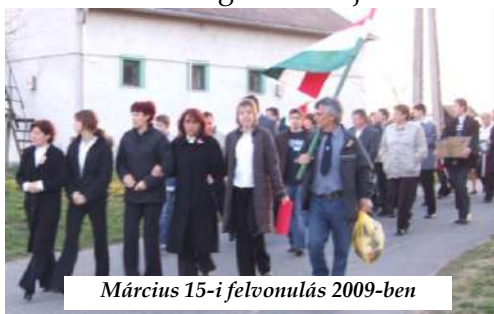
Március 15-i felvonulás 2009-ben

A csata előestéjén már kisebb ütközet zajlott le a közeli Pátkánál a sümegi zászlóalj és a fosztogató horvátok között.