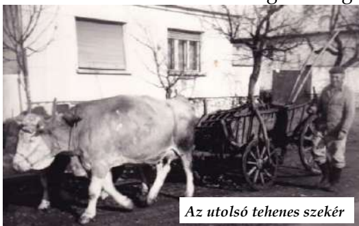
Az utolsó tehenes szekér

elmaradt elszámoltatása és a rablóprivatizáció miatt félresiklott rendszerváltoztatásban itt is csalódtak az emberek és e helyi pártcsoportok pár év alatt inaktívvá váltak, és sajnos a demokratikus pártok tevékenysége is fokozatosan megszűnt.