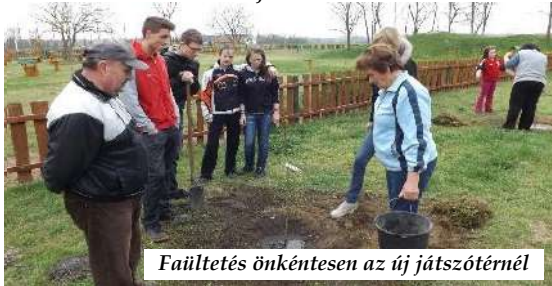
Faültetés önkéntesen az új játszótérnél

2007-ben beépítették a sportöltöző tetőterét. Egy kutat is fúrattak és kiépítették a vízvezeték rendszert, mely lehetőséget biztosít a sporttelep locsolására. Földkábelek lefektetésével áramvételezési pontokat hoztak létre, így a kivilágítható terület akár éjszakai rendezvény megtartására is alkalmas. Kialakítottak egy kézilabdapályát és a sporttelep utolsó, de a gyerekek által legkedveltebb területéhez játszótér épült. A 90-es években az akkori képviselő testület által felajánlott tiszteletdíjből aszfaltburkolattal lett ellátva a Sport utca . 2008-ban felújították az iskola tornatermét , öltözőjét és vizesblokkját.