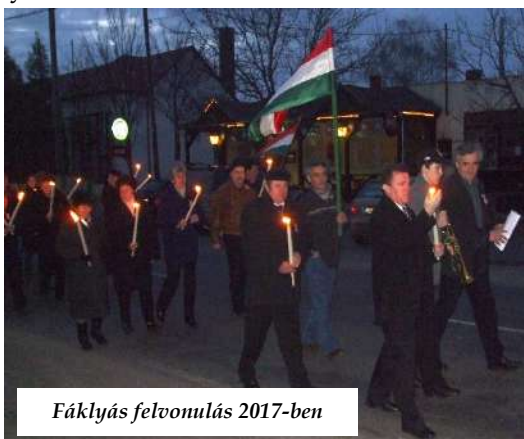
Fáklyás felvonulás 2017-ben

A legrégebbi ilyen emlékmű a temetői 48-as kereszt , melyre a Szent János Polgári Kör helyezte el emléktáblát. A táblán a 48-as káptalanfai honvédek nevei találhatóak, akik részt vettek az 1848-as pákozdi csata pát-