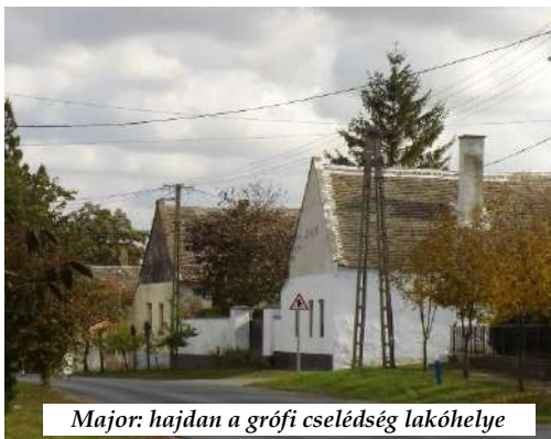
Major: hajdan a grófi cselédség lakóhelye

Káptalanfa ebben az időben Zala vármege sümegi járásában a második legnagyobb létszámú falu. Közös Községi tanács székhelye. Hozzá tartozó kisközség: Bodorfa, Gyepükaján és Nemeshany.