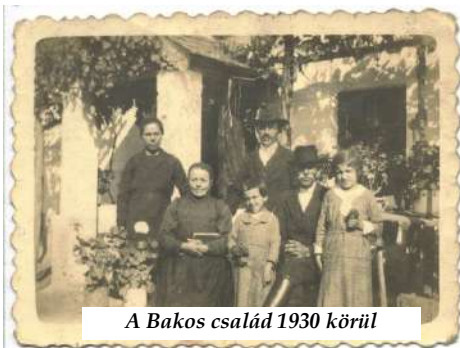
A Bakos család 1930 körül

Ennek alapján készült el 1780-ban a falu urbáriuma, mely rögzítette a falu birtokviszonyait, a jobbágyok (41 fő) és zsellérek (10 fő) kötelezettségeit (robot, kilenced, adónemek).