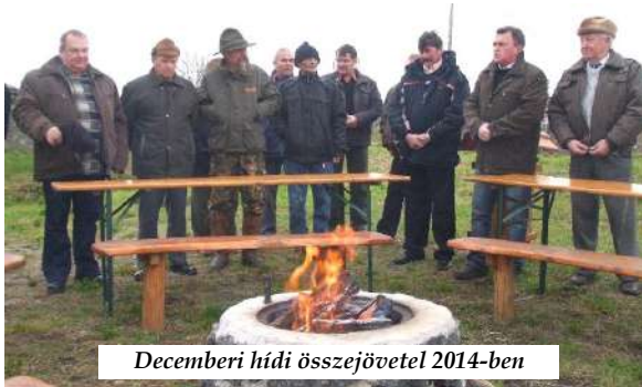
Decemberi hídi összejövetel 2014-ben

A plébánia épületén a megtörtént a a tetőszerkezet felújítása, melyet az Érsekség is támogatott, és részben a plébánia belső felújítása is megvalósult.