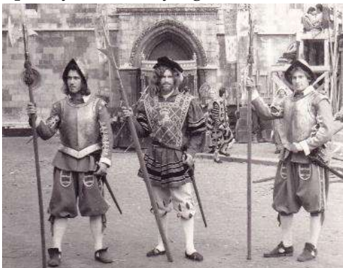
„Harcosaink” filmforgatásnál, 1982-ben

A megállapodás szerint a réteket, vetéseket és a Parrag nevű tilalmas kaszálókat kivéve szabadon legeltethették barmaikat mindkét falu lakói. S egyben elhatározhatták azt is, hogy a két szomszédos birtokot elhatárolhatják. A lakosság létalapját a földművelés és az állattenyésztés jelentette. Határa tágas, szántói jól termők. A föld inkább rozs termelésére volt alkalmas. A falut 1473. 03. 31-én keltezett regeszta szerint Mátyás király hadi érdemei fejében az udvari katonasága kapitányának, Enyingi Török Ambrusnak, és feleségének, Devecseri Csoron Katalinnak adományozta Devecser, Pápa városokkal és számos környékbeli faluval (Sárosd, Sarofü, Kisdevecser stb.) együtt.