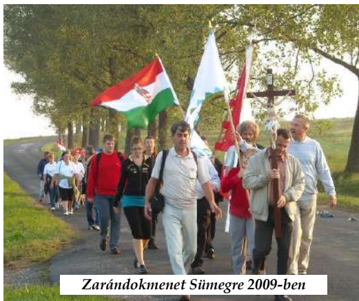
Zarándokmenet Sümegre 2009-ben

A főoltár mögött a karácsony titka, Jézus születése jelenik meg. A templomhajóban két festmény látható: egyik a Nagypéntek és Húsvét eseményeit, a másik az Egyház születését, Pünkösöd ünnepét és a XX. század