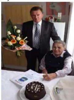
95 éves polgár köszöntése