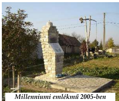
Millenniumi emlékmű 2005-ben