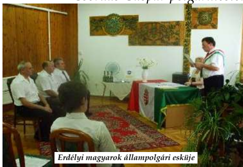
Erdélyi magyarok állampolgári esküje