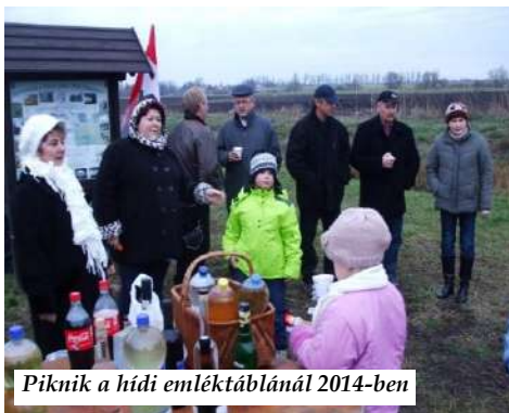
Piknik a hídi emléktáblánál 2014-ben