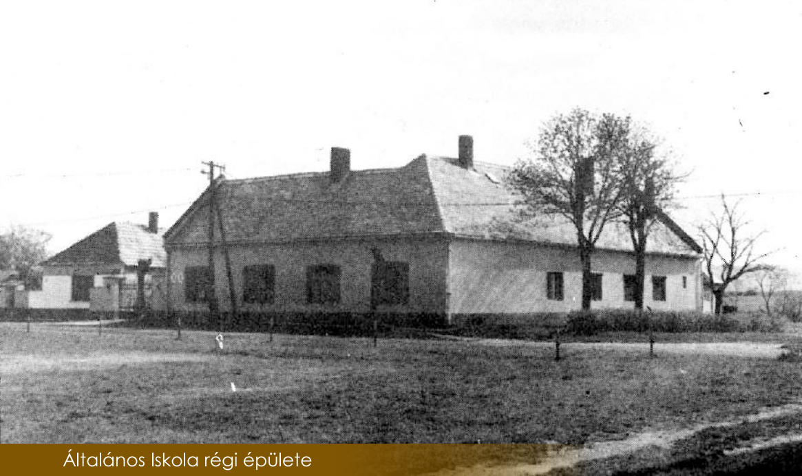
Általános Iskola régi épülete

Említést kell tennünk a település egykoron kiemelkedően működő iskolájáról is; jelenlegi épületét 1905-ben egyházi segítséggel a már egyesített falunak hozták létre, akkor 126 tanulóval. Habár az iskola 1978-ban megszűnt, 1992-ben elsőtől harmadik osztályig, egy rövid ideig újra indult, ezzel párhuzamosan pedig óvoda is létrejött. Ma már csak az óvoda működik, az iskoláskorú gyerekek a szomszédos káptalanfai vagy csabrendeki általános iskolába járnak.