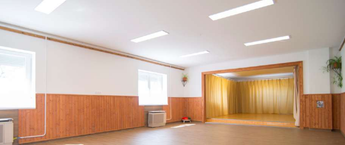
A falu nagyterme