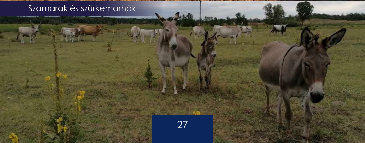
Szamarak és szürkemarhák