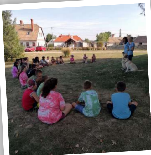
Napközis Tábor Gyepükaján 2021